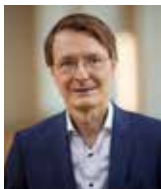
Prof. Dr. Karl Lauterbach Bundesminister für Gesundheit Mitglied des Deutschen Bundestages

Die Entwicklungen im Bereich der KI machen Hoffnung, dass wir im Kampf gegen den Krebs künftig einen großen Schritt voran kommen. Die Potenziale sind immens – bei ihrer Umsetzung kommt es auf uns alle an. Der Austausch auf dem CIO-Krebs-Informationstag leistet hierzu einen wichtigen Beitrag. Ich danke den Veranstaltern und allen Teilnehmerinnen und Teilnehmern für ihren Einsatz!