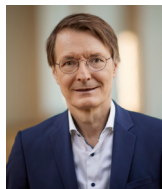
Prof. Dr. Karl Lauterbach Bundesminister für Gesundheit Mitglied des Deutschen Bundestages

Die Entwicklungen im Bereich der KI machen Hoffnung, dass wir im Kampf gegen den Krebs künftig einen großen Schritt voran kommen. Die Potenziale sind immens – bei ihrer Umsetzung kommt es auf uns alle an. Der Austausch auf dem CIO-Krebs-Informationstag leistet hierzu einen wichtigen Beitrag. Ich danke den Veranstaltern und allen Teilnehmerinnen und Teilnehmern für ihren Einsatz!